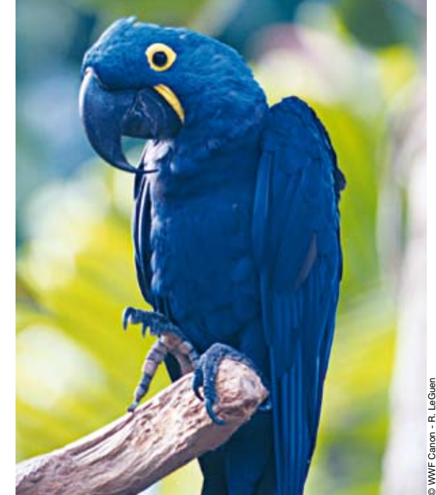
Hyazinthara: wunderschön, aber schon sehr selten

Bring von deinem Urlaubsort doch Töpfereien, T-Shirts oder am besten selbstgemachte Fotos mit und lass die Finger von Souvenirs aus Tieren und Pflanzen. So kannst du auch im Urlaub etwas für den