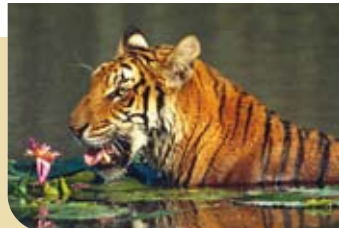
Tiger: nur mehr 4.500 Tiere.

Nur mit streng kontrollierten Schutzgebieten und gut ausgebildeten Rangern hat der Tiger eine Chance. Wenn Sie sich für die elegante Großkatze interessieren, dann werden Sie Wildlife-Pate des WWF ( www.wwf.at/patenschaft ).