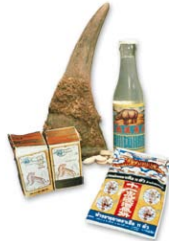
Verboten: Nashorn- und Tigerpräparate.

Der Duft, aus dem die Träume sind: Mehr als 300 traditionelle chinesische Medikamente und einige Parfums enthalten Moschus, eine Absonderung der Duftdrüsen des Moschustieres, einer kleinen Hirschart. Dessen Einfuhr in die EU ist größtenteils verboten. Für Medikamente aus dem Horn der Saiga-Antilope und den mittlerweile stark dezimierten Seepferdchen brauchen Sie behördliche Dokumente. Obwohl stark bedroht, werden Millionen von ihnen jährlich für chinesische Apotheken verpulvert, zerrieben und gekocht.