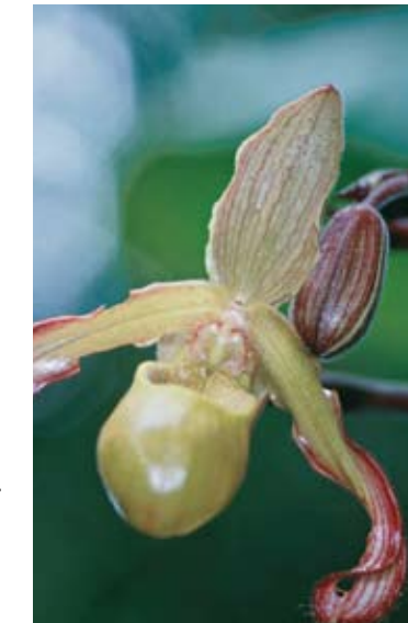
Orchidee: Wildpflanzen nur mit Papieren.

Für lebende Pflanzen besonders bedrohter Arten, z. B. für Orchideen, Kakteen, verschiedene Tillandsien- und Euphorbienarten, aber auch für das Schneeglöckchen, brauchen Sie daher – so nicht überhaupt ein Handelsverbot besteht – Aus- und zum Teil auch Einfuhrgenehmigungen der Behörden, für alle Arten Pflanzengesundheitszeugnisse. Keine Papiere benötigen Sie für Schnittblumen aus künstlich vermehrten Pflanzen und für „Rainsticks“ (=Musikinstrumente aus Kakteenholz), von denen Sie drei Stück frei einführen dürfen.