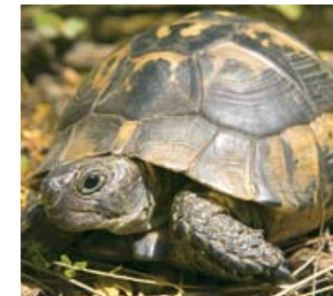
Griechische Landschildkröte: nicht aus der freien Wildbahn.

Wenn Sie trotzdem ein exotisches Tier aus dem Ausland einführen wollen, müssen Sie einige Zeit vor Ihrer Abreise bei der österreichischen CITES-Behörde (BMLFUW) eine Einfuhrgenehmigung für die betroffene Art einholen. Wenn kein Handelsverbot besteht, wird überprüft, ob Sie das beantragte Tier artgerecht halten können. Im Ausland müssen Sie Ausfuhrgenehmigung und Gesundheitszeugnisse besorgen. Bei der Einreise ist mit einiger Zeit Quarantäne zu rechnen.