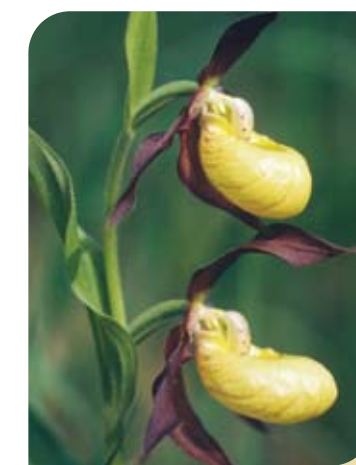
Frauschuh: in freier Natur kaum noch zu finden.

Impressum: WWF Österreich, Ottakringer Straße 114–116, 1160 Wien, Tel.: 0043/1/48817-0, ZVR. Nr.: 751753867, Schöllerbank 19200 Kto-Nr.: 07526661015 • Projektleitung: Jutta Jahrl • Redaktion: Karin Enzinger, Gerald Dick • Layout: Richard Fürstner • Produktion: message Marketing & Communications GmbH, 1120 Wien • Druck: gugler cross media, Melk • Wir danken jenen Fotografen, die uns ihr Bildmaterial freundlicherweise gratis zur Verfügung gestellt haben • Stand Mai 2008.