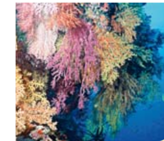
Korallenriffe: 10% komplett zerstört, 56% bedroht.

ist z.B. die Einfuhr von Schnitzereien aus Walzfähen und -knochen in die EU ohne Ein- und Ausfuhrdokumente. Auf Schildkrötenpanzer, -öl, Käbme und Brillenfassungen aus Schildpatt müssen Sie ebenfalls verzichten.