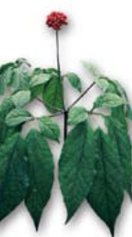
Ginseng: Tees und Pillen der Zuchtform wählen!

Adonisröschen und Ginseng etwa kommen in freier Natur kaum noch vor. Für die Einfuhr von deren Wurzeln und für Aloe-Produkte (außer Aloe vera) brauchen Sie zumindest Ausfuhrdokumente. Ginsengtees und -kapseln sind unproblematisch, fragen Sie aber nach der Zuchtform.