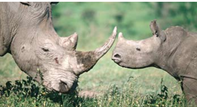
Nashörner: strenger Schutz durch CITES.

Um 90 Prozent sind die weltweiten Tigerbestände in den letzten Jahrzehnten zurückgegangen – dafür ist zum großen Teil TCM verantwortlich. Für Präparate mit Tigerknochenmehl oder -wein, pulverisiertem Nashorn-Horn oder Bären-galle gibt es keine Einfuhrgenehmigungen in die EU.