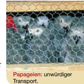
Papageien: unwürdiger Transport.

Der Ärger, den Sie sich durch illegale Mitnahme lebender Tiere – eines Papageis oder einer Schildkröte – „einhandeln“, ist vorprogrammiert. Die Höhe der Geldstrafen ebenso: bis zu € 36.336,- oder 2 Jahre Haft. Sie benötigen nämlich für die Einfuhr lebender Tiere immer tierärztliche Gesundheitszeugnisse und für viele Arten Artenschutzpapiere.