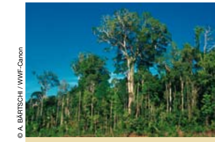
Mahagoni: selten, daher geschützt.