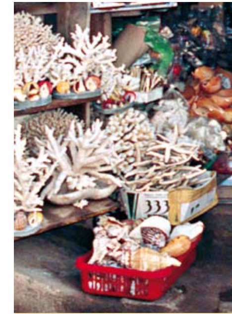
Marktstand: mehr Vielfalt als im Meer.

Der Überfluss am Marktstand täuscht. Im Meer wurden viele Schnecken- und Muschelarten bereits so selten, dass ihr Handel heute kontrolliert wird. Daher benötigen Sie z. B. für mehr als drei Feichterschnecken und Riesenschnecken behördliche Ausfuhrdokumente. Achtung: Papiere von Straßenhändlern sind ungültig. Vorsicht auch beim Muschel-Sammeln am Strand – bedrohte Arten könnten darunter sein! Auch für die meisten Arten von Korallen und Korallenschmuck benötigen Sie Ausfuhrdokumente. Durch Souvenirproduktion, Überfischung, Wasserverschmutzung und Klimawandel sind die Korallenriffe der Welt bereits stark unter Druck.