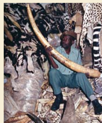
Keine Lizenz zum Töten! Fördern Sie nicht die Wilderei! No license to kill! Don't enhance poaching!