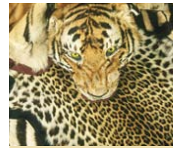
Bedrohliche Beliebtheit: Häute von Raubkatzen.

Leopard, Jaguar und Ozelot haben sich vom Pelzhandel der 70er-Jahre noch immer nicht erholt. Die Einfuhr von Häuten, Zähnen und Klauen von Raubkatzen in die EU ist streng reglementiert.