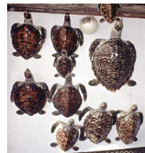
Schildkrötenpanzer: Ausverkauf der Natur!

Mit dem Washingtoner Artenschutzübereinkommen (auch CITES genannt) und der für Österreich gültigen EU-Artenschutzverordnung wird dieser Handel heute kon-