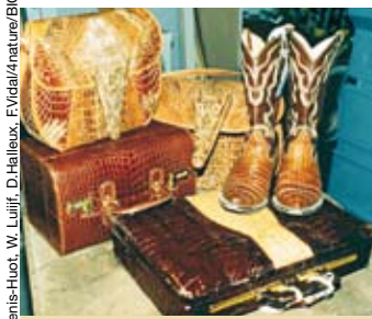
Krokotaschen und -schuhe: vier Stück sind erlaubt.