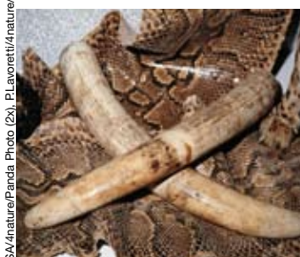
Achtung: Elfenbein und Schlangenleder.

Kaufen Sie keine Schmetterlinge aus tropischen Ländern. Für einige Arten ist die Einfuhr verboten, für andere brauchen Sie Ausfuhrdokumente.