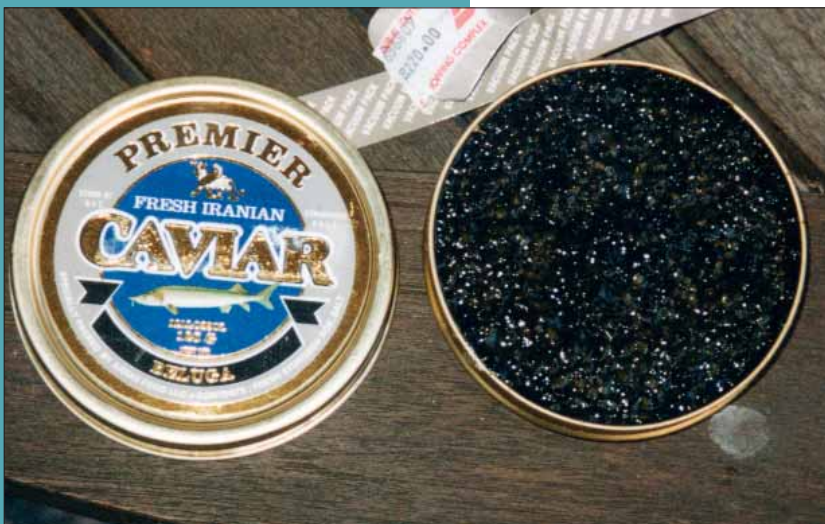
Belugakaviar kann Verkaufspreise von bis zu 600 Euro pro 100 Gramm erzielen

Eine detaillierte Beschreibung der Informationen, die auf den Etiketten aufgeführt werden müssen, findet man in der CITES Resolution Konf. 12.7 (Rev. CoP14) . Als Folge dieser Entwicklungen haben die CITES Vertragsstaaten weltweit angefangen, auf nationaler Ebene gesetzliche und administrative Maßnahmen zu erlassen und durchzuführen, um den CITES Beschlüssen bei der Kaviaretikettierung nachzukommen. Die Europäische Union (EU) verabschiedete im Mai 2006 die Verordnung (EC) Nr. 865/2006 der Kommission, die die Verordnung (EC) Nr. 1808/2001 ersetzt und machte somit die