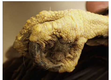
Abb. 2: Der verkrampfte Greif eines durch Gift verendeten Kaiseradlers. Verkrampfungen an toten Tieren sind Indizien für das Vorliegen einer Vergiftung.