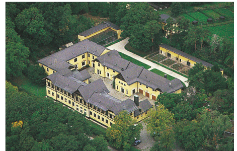
Abb. 13: Am Forschungsinstitut für Wildtierkunde am Wilhelminenberg werden die Untersuchungen an verendeten Wildtieren und mutmaßlichen Ködern durchgeführt.

Department für Pathobiologie Institut für Pathologie und gerichtliche Veterinärmedizin der Veterinärmedizinischen Universität Wien Veterinärplatz 1, 1210 Wien Tel: 01 / 25077 – 2405 bzw. – 2438 (Sezierraum); e-mail: gerhard.loupal@vu-wien.ac.at