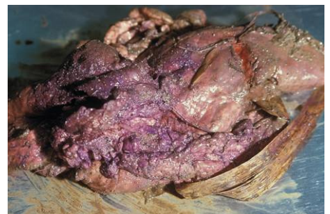
Abb. 3: Ein mit Carbofuran präparierter und als Giftköder verwendeter Aufbruch. Die blauviolette Warnfärbung ist leicht erkennbar.