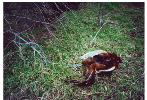
Abb. 4: Ein als Köder verwendeter und befestigter Fasan. Auch dieses Tier wurde mit Furdan® präpariert.