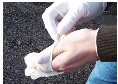
Abb. 11: Aus Gründen des Eigenschutzes sollte auf Handschuhe unter keinen Umständen verzichtet werden.