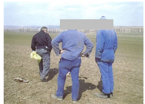
Abb. 10: Am Fundort wird unter dem Beisein der Finder ein Augenschein durchgeführt. Im Bild eine Sachverhaltsaufnahme durch einen Beamten des GP Bernhardsthal im Frühjahr 2003.