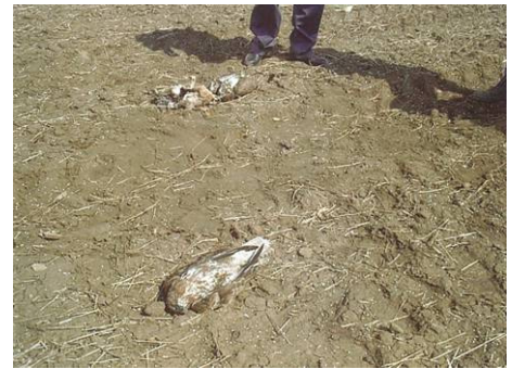
Abb. 9: Der Fund zweier Mäusebussarde in unmittelbarer Nähe zu einem Giftköder auf freiem Feld. Ein typischer Giftfall.

Da in vielen Fällen durch einen Giftköder mehrere Opfer zu beklagen sind, ist die Nachsuche nach weiteren Opfern ebenfalls sehr wichtig. Vögel (z.B. Mäusebussarde, Seeadler,...), auf die das Gift besonders schnell wirkt, sind meist unweit des Köders in