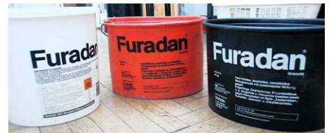
Abb. 5 u. 6: Carbofuran als Furadan® Granulat. Dieses mittlerweile EU-weit verbotene Pflanzenschutzmittel wird sehr oft zum Präparieren von Giftködern verwendet. Bei Vögeln wirkt es besonders schnell und ist bereits in sehr geringen Dosen tödlich.