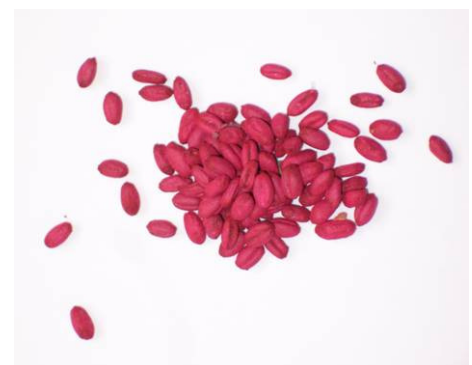
Abb. 8: Beispiel für ein Giftweizenpräparat mit roter Warnfärbung. Der Wirkstoff beim abgebildeten Präparat ist Zinkphosphid.