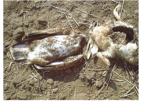
Abb. 1: Ein vergifteter Mäusebussard in unmittelbarer Nähe des Köders, eines Feldhasenkadavers.

Giftverdachtsfälle bei Haustieren werden zumeist über den Besitzer und/oder den Tierarzt angezeigt. Offensichtlich wird ein Vergiftungsverdacht meist durch plötzlich auftretende Krämpfe und durch Erbrechen der Tiere . Die Tierärzte sollten angehalten werden, vermeintlich kontaminiertes Material (z.B. Erbrochenes) aufzubewahren und für eine Laboruntersuchung bereitzustellen.