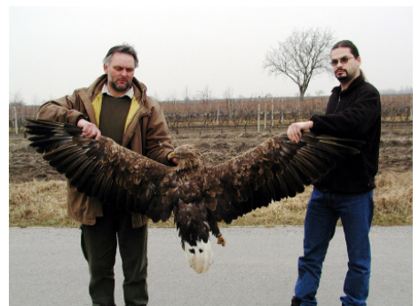
Abb. 16: In allen Bundesländern steht der Seeadler unter Naturschutz oder unter ganzjähriger Schonung. Er galt lange als ausgestorben und kehrt nun langsam nach Österreich zurück. Bisher wurden 17 Seeadler Opfer von Giftködern.

Primär sind die Strafnormen nach dem Strafgesetzbuch heran zu ziehen. Die wichtigste Strafnorm ist in jedem Fall der § 222 StGB – Tierquälerei , der im Fall einer Vergiftung von Haus- und Wildtieren herangezogen werden kann. Bei Haustieren kann auch der Tatbestand der Sachbeschädigung (§ 125 StGB) ins Treffen geführt werden. § 138 StGB als schwerer Eingriff in ein