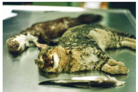
Abb. 14: Eine mit Carbofuran vergiftete Katze und ein Steinmarder. Die verkrampften Gesichtszüge weisen auf einen qualvollen Tod hin. Haustiere werden am Institut für Pathologie der Veterinärmedizinischen Universität in Wien untersucht.