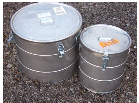
Abb. 15: Behälter, wie die hier abgebildeten Hobbocks, stehen an allen Veterinärabteilungen der Bezirksverwaltungsbehörden zum Versand von Kadavern und vermeintlichen Ködern bereit.

An allen Veterinärabteilungen der Bezirksverwaltungsbehörden stehen Hobbocks (plombierbare Behälter) zur Verfügung. Diese werden mit der Post auf dem schnellsten Weg an die Untersuchungsstelle geschickt. Sollten die Hobbocks nicht verfügbar sein, wird das Untersuchungsmaterial gut verpackt und am besten vorab gekühlt oder gefroren verschickt. Beim Verpacken ist in jedem Fall darauf zu achten, dass das kontaminierte Material in mehrere Plastiksäcke verpackt wird und absolut dicht ist, damit sich beim Auftauen des Materials keine Gefahr bei der Weiterbearbeitung dieses Paketes (z.B. für Postbedienstete) ergibt.