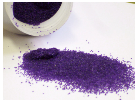
Abb. 7: Carbofuran als Furadan® Granulat. Typisch ist die blauviolette Warnfärbung.