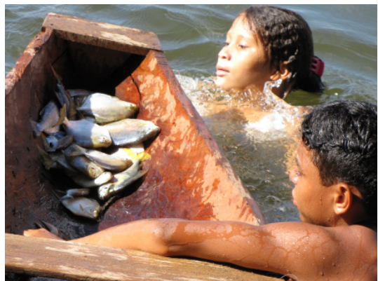
Die Lebensgrundlagen der Bewohner der ‚Volta Grande‘ sind durch ‚Belo Monte‘ akut bedroht.

Die Gesamtkosten für das Projekt sind noch äußerst unklar. Ursprünglich wurde mit 7 Mrd. Real (ca. USD 4 Mrd./EUR 3 Mrd.) gerechnet. Mittlerweile wurden die Zahlen von der Regierung auf 19,6 Mrd. Real (ca. USD 11,2 Mrd./EUR 8,5 Mrd.) erhöht. 19 Die Kosten für die zu errichtenden langen Hochspannungsleitungen sind hier noch nicht berücksichtigt. Die an der Errichtung des Kraftwerks interessierten Baufirmen schätzen die Gesamtkosten zwischen 20 und 30 Mrd. Real (USD 11,4 und 17 Mrd./EUR 8,7 und 13 Mrd.) ein.