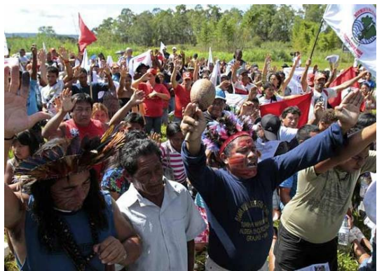
Proteste nach der turbulenten Versteigerung der Lizenz zur Errichtung von ‚Belo Monte‘.