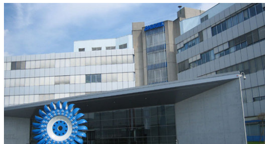
Der österreichische Turbinenhertsteller Andritz AG könnte zu einem der Nutznießer von ‚Belo Monte‘ werden.