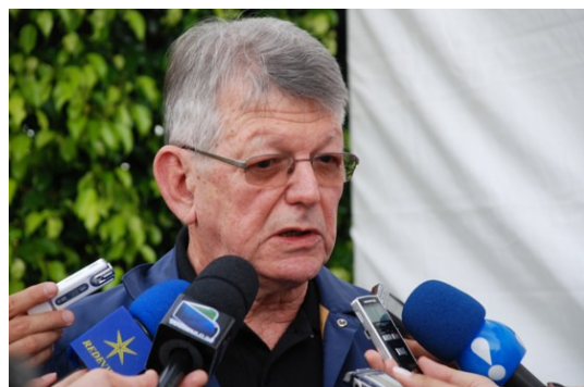
Bischof Erwin Kräutler stellt sich seit Jahrzehnten vehement auf die Seite der Betroffenen des Staudammbaus .

Der aus Österreich stammende Dom Erwin Kräutler , Bischof der Prälatur Xingu und Präsident des Indianermissionsrats der brasilianischen Bischofs-