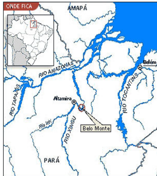
Lage des geplanten Kraftwerks ‚Belo Monte‘ an der „Großen Schlinge“ (Volta Grande) des Xingu-Fluss.

Das Projekt wurde bereits früher aufgrund des Widerstands der am Xingu lebenden indigenen Bevölkerung gestoppt. Unter dem Namen „Belo Monte“ wurde es von Präsident Luíz Inácio Lula da Silva zu einem Schlüsselprojekt des ambitionierten „Programms zur Beschleunigung des Wachstums“ (Programa de Aceleração do Crescimento, PAC) gemacht. Seither wird es ohne Berücksichtigung der Einwände der betroffenen Bevölkerung und der Wissenschaft durch gepeitscht. Die neue brasilianische Präsidentin Dilma Rousseff hat gleich zu Beginn ihrer Amtszeit den Druck weiter erhöht und setzt sich über die geltenden Umweltgesetze hinweg.