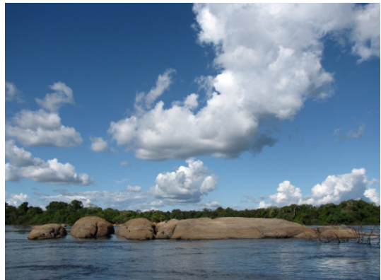
Die einzigartige Artenvielfalt des Xingu droht unwiederbringlich verloren zu gehen