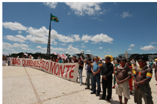
Proteste gegen die Errichtung von „Belo Monte“ im Regierungsviertel von Brasília.0