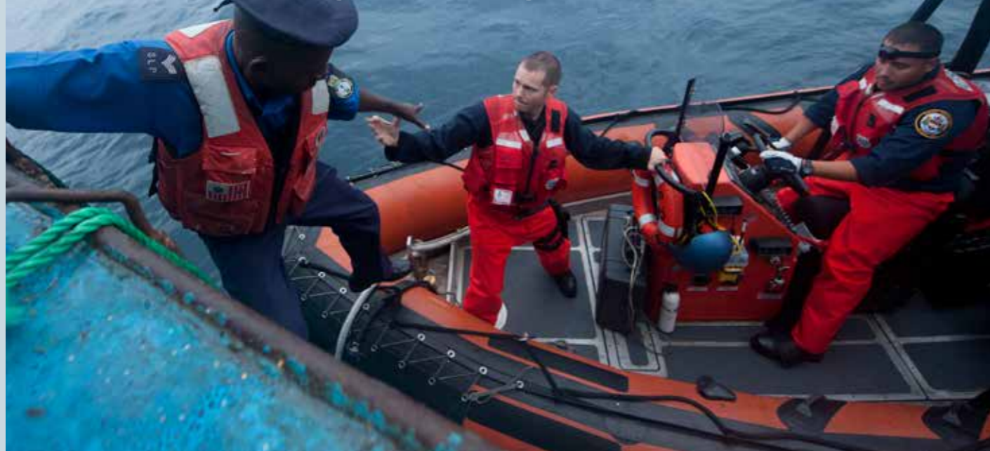
KONTROLLEN, SIERRA LEONE

Das Instrument ist gut, es muss nur konsequent von allen Beteiligten angewendet werden