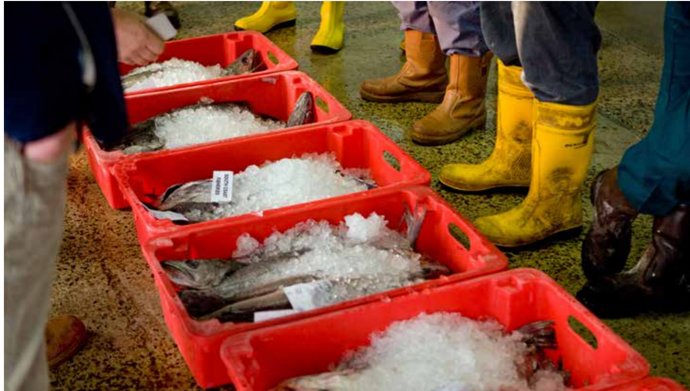
© NATUREPL.COM/TOPY ROXBURGH/MWF FISCHAUKTION, NEWLYN, CORNWALL