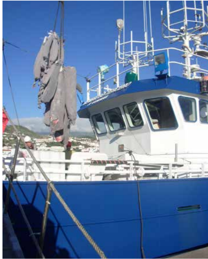
ENTLADUNG VON FISCH VON EINEM SPANISCHEN LANGLEINERFISCHER

Die Verordnung untersagt allen EU-Bürgern - unabhängig davon, unter welcher Flagge sie fahren - die direkte oder indirekte Ausübung oder Unterstützung von IUU-Fischereiaktivitäten und sieht im Falle eines Verstoßes Sanktionen vor. Bei schwerwiegenden Zuwiderhandlung 18 müssen die EU-Mitgliedstaaten eine Höchststrafe verhängen, die mindestens fünfmal so hoch ist wie der Wert des illegalen Fanges, bzw. achtmal so hoch im Falle eines wiederholten Verstoßes innerhalb eines Zeitraums von fünf Jahren.