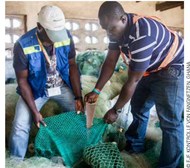
KONTROLLE VON FANGNETZEN, GHANA

Ein zentraler Aspekt der Verordnung besteht in der Verpflichtung für Mitgliedstaaten, Maßnahmen gegen ihre Staatsangehörigen zu ergreifen, die in IUU-Fischerei verwickelt sind. Gleichzeitig müssen ihnen geeignete Mittel zur Verfügung stehen, um Täter bei schweren Verstößen wirksam bestrafen zu können. Während mehr als die Hälfte der Mitgliedstaaten angibt, diese Anforderungen in ihr nationales Recht umgesetzt zu haben, fehlen sowohl Informationen über die Höhe der verfügbaren Strafen als auch Angaben zu den bisher ergriffenen Maßnahmen. Es bestehen darüber hinaus Zweifel, ob die Rechtsvorschriften von allen Mitgliedstaaten in vollem Maße angewendet