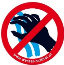
Wolfgang Retter Sprecher Netzwerk Wasser Osttirol