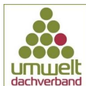
Franz Maier Präsident Umweltdachverband