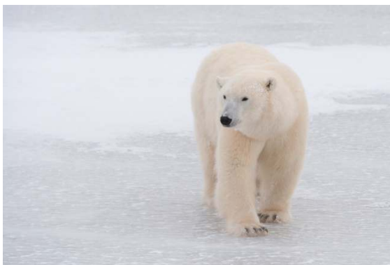
Der Eisbär: Das bekannteste Tier, das unter der Erderhitzung leidet

Die Eismassen an Nord- und Südpol und auch unsere Gletscher schmelzen, der Meeresspiegel steigt, Stürme und starker Regen nehmen zu. In manchen Ländern gibt es Überschwemmungen, während anderswo in der Landwirtschaft das Wasser fehlt. Wir merken die Erderhitzung auch an langen Hitzewellen im Sommer, die der Gesundheit der Menschen schaden können. Auch viele Tierarten sind betroffen. Können sie sich nicht schnell genug an die Klimaveränderungen anpassen, werden sie aussterben.