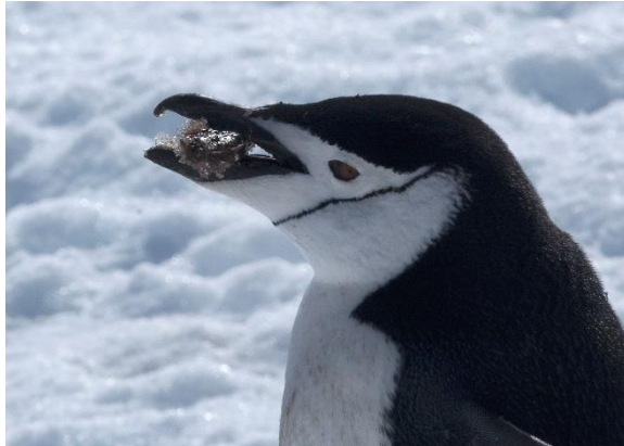
Ein Zügelpinguin lässt es sich schmecken.

Pinguine sind durch die Überfischung der Meere bedroht, denn riesige Fangflotten der Menschen fischen auch ihnen die Nahrung weg.