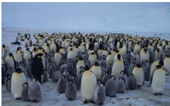
Eine Kolonie mit 20.000 Pinguinen benötigt ca. 20 Tonnen Nahrung pro Tag!

Während des Winters leben Pinguine getrennt voneinander im Meer. Zur Paarung, zur Jungenaufzucht und während der Mauser - dem Federwechsel bei Vögeln - leben sie gemeinsam mit ihren Partnern in großen Gruppen - so genannten Kolonien - an Land.