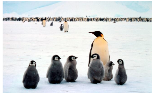
Bei Kaiserpinguinen übernimmt das Männchen die komplette Brutzeit.

Pinguine werden je nach Art zwischen zwei und sechs Jahren geschlechtsreif. Wenige Tage nach der Befruchtung werden die Eier gelegt. Größere Pinguinarten legen ein Ei, kleinere meistens zwei. Abhängig von der Größe der Eier dauert es bis zu 68 Tage bis die Küken schlüpfen. Pinguine wechseln sich sowohl beim Brüten als auch bei der Aufzucht der Jungen ab. Während ein Partner auf Nahrungssuche ist, kümmert sich der andere um den Nachwuchs.