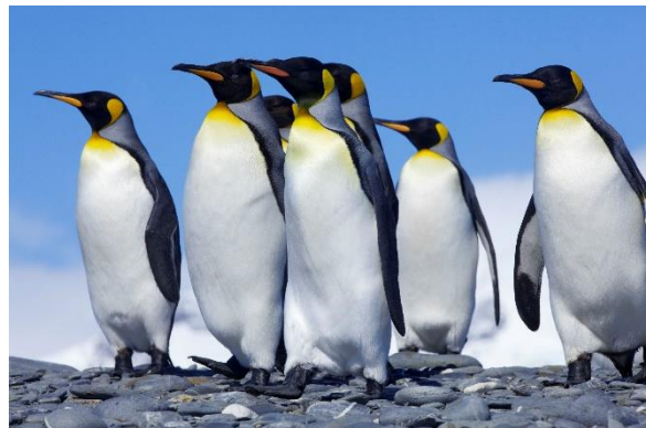
Pinguine sind perfekt an das Leben in der Kälte angepasst.

Temperaturen ist. Die braucht vor allem der Kaiserpinguin in der Eiseskälte der Antarktis.